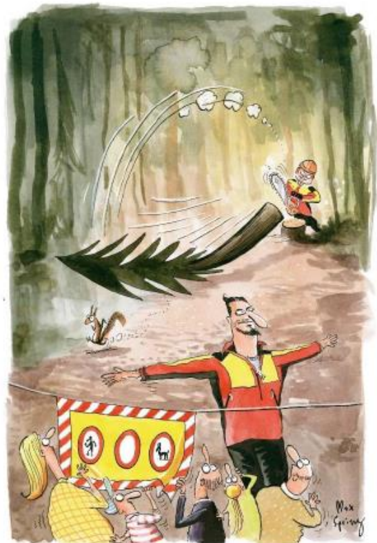
Illustration: Max Spring, Waldknighte der Arbeitsgemeinschaft für den Wald